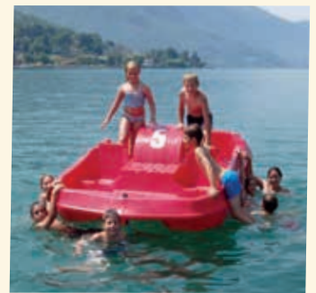
2004 - Le Bouveret