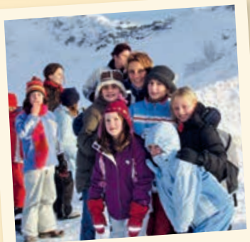
2004 - Sortie aux Rochers de Naye