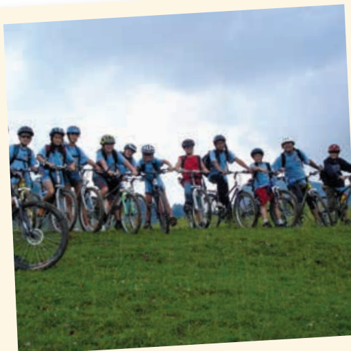
2006 - Camp vélo