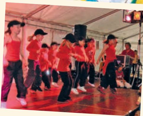
2006 - Les Fêtes de Blonay