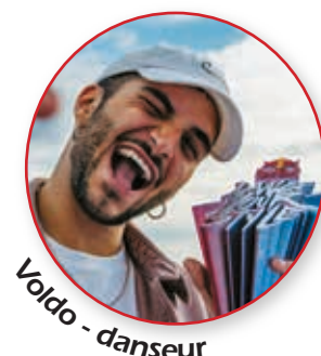
Voldo - danseur