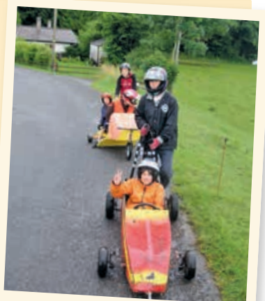
2007 - Course de caisse à savon

Informations et inscriptions : 021 564 03 80 - maisonpicson@bstl.ch