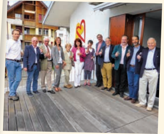
2014 - Fondation Lehmann