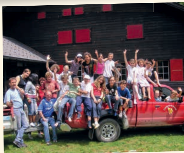
2007 - Camp Rosalys