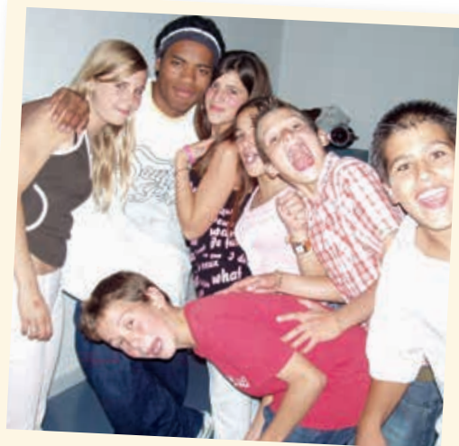
2005 - Soirée disco

Ils ont lieu chaque semaine, sauf pendant les vacances scolaires. Ne pas hésiter à contacter Virginie sur son portable.