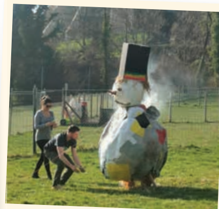
2022 - Bonhomme d'hiver