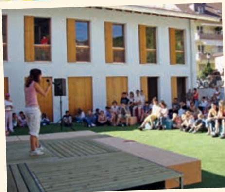
2004 - The Spectacle