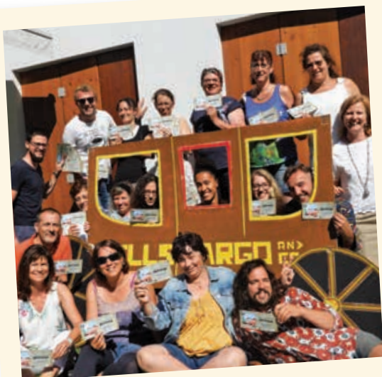
2018 - Picsonnets

Pour tous les autres, qu'ils aient été monitrices ou moniteurs de camps, stagiaires, professeurs des cours, collaborateurs du service, voire même enfants à Picson, ils sont devenus des «Picsonnets» ! Les photos souvenirs ci-dessous en témoignent, on passe d'excellents moments à la Maison Picson.