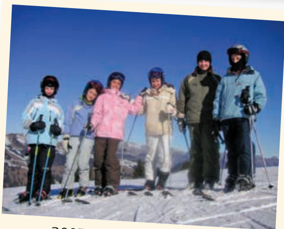
2007 - Ski à Saanenmöser