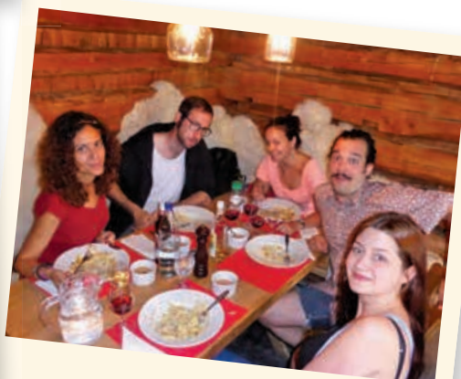
2016 - Picsonnets