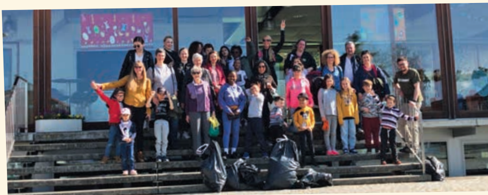
2022 - Coup de balai

Cette action s'étend du mercredi 1 er mai au dimanche 2 juin 2024.