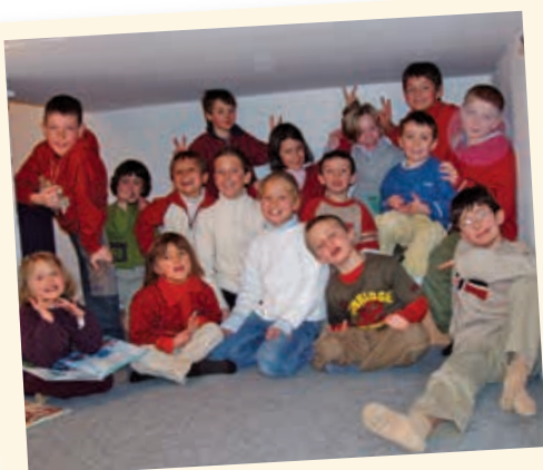
2004 - Trou de souris

Activités d'extérieur, petites randonnées, etc... , sur inscription