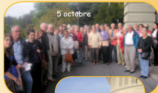
Berne Palais fédéral