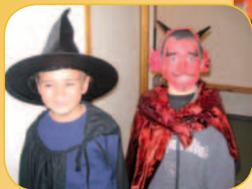
Halloween 31 octobre