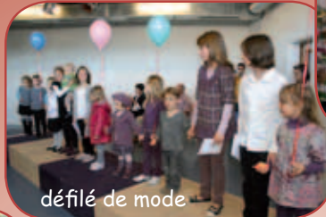
défilé de mode