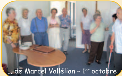
... de Marcel Vallélian - 1 er octobre