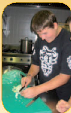
Repas des Seniors 28 octobre