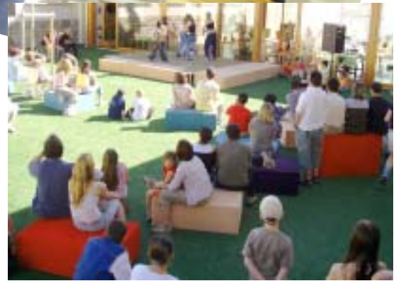
«The Spectacle». Samedi 26 juin