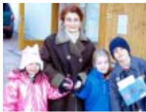
Premier accueil. Mardi 2 mars