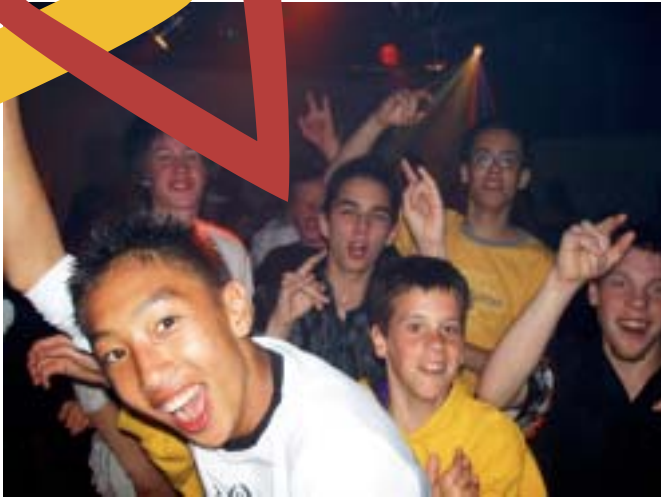
Soirée Disco. Samedi 24 avril