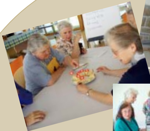
Rallye du Rayon d'Automne. Mardi 25 mai