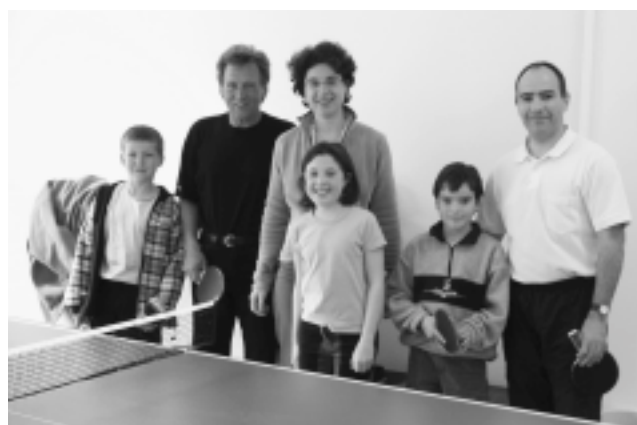
Participants du tournoi de ping-pong