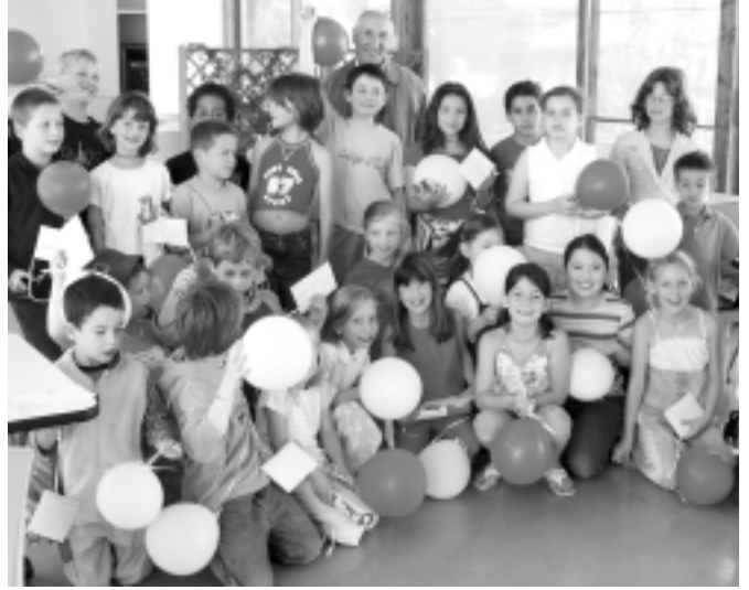
Les lauréats du concours