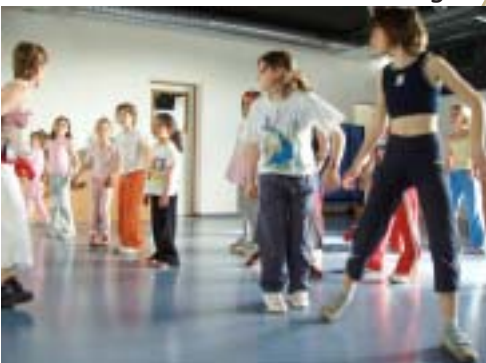
Le cours Kid Jam Dancing