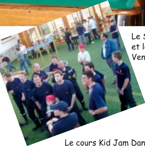
Le Syndic, les Pompiers et les Jeunes Citoyens. Vendredi 4 juin